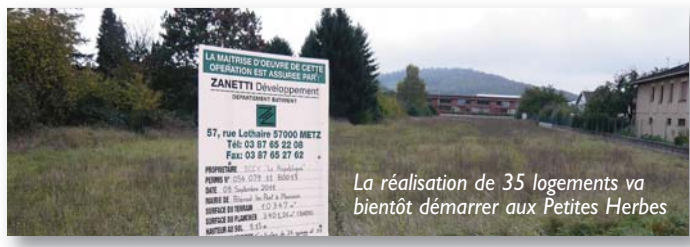
La réalisation de 35 logements va bientôt démarrer aux Petites Herbes