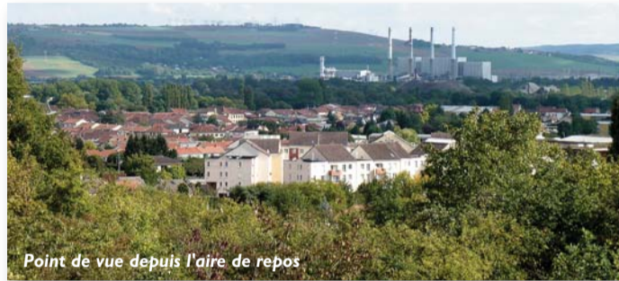
Point de vue depuis l'aire de repos

Le projet n'en est qu'à ses débuts. L'idée est non seulement de faire du coteau un espace éducatif et ludique avec un balisage approprié et le signalement d'espèces végétales remarquables, mais aussi d'encourager les propriétaires de vergers à redonner vie à des terrains aujourd'hui en friche.