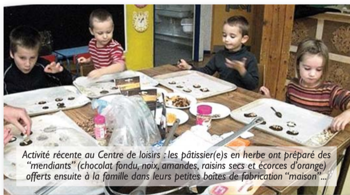
Activité récente au Centre de loisirs : les pâtissier(e)s en herbe ont préparé des "mendiants" (chocolat fondu, noix, amandes, raisins secs et écorces d'orange) offerts ensuite à la famille dans leurs petites boîtes de fabrication "maison"...

Le centre de loisirs Michel-Bertelle (enfants de 3 à 11 ans) ne fonctionnera que la première semaine des vacances de fin d'année, du lundi 19 au vendredi 23 décembre, de 8 h à 18 h. Inscriptions et paiement au moins 48 heures à l'avance, en mairie (du lundi au vendredi de 8 h 30 à 12 h et de 13 h 30 à 17 h). Renseignements au 03 83 80 43 00.